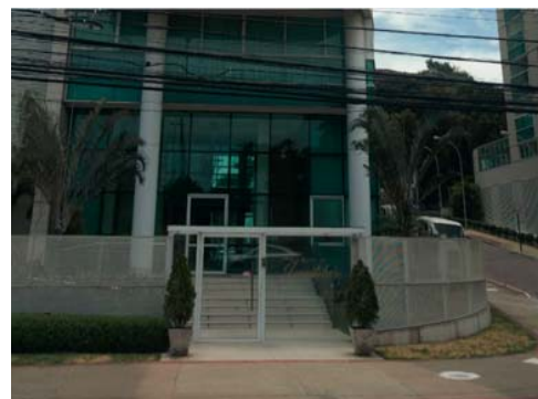
Av. Saturnino de Brito, 583 / ES