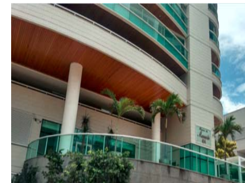
Alameda Doutor Carlito Von Schilgen / ES