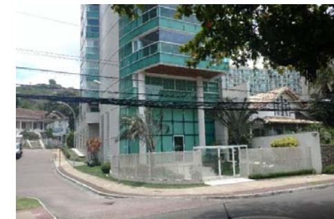
Alameda Doutor Carlito Von Schilgen / ES