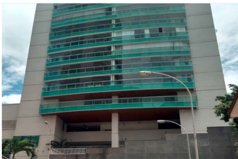
Av. Saturnino de Brito, 595 / ES